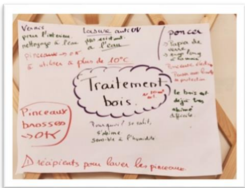
Projet & Méthodologie : le recours aux cartes mentales est un excellent système pour ne rien oublier. Savoir les construire est une compétence précieuse pour l'autonomie