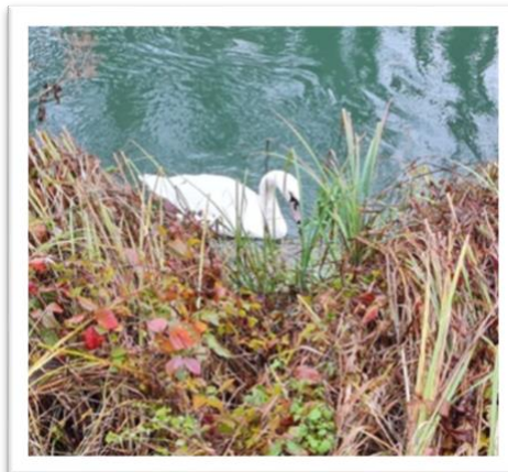
Pédagogie renforcée en pleine nature : ces moments passés à l'extérieur permettent de mieux fixer les notions : ici l'écosystème et la biodiversité prennent tout leur sens.