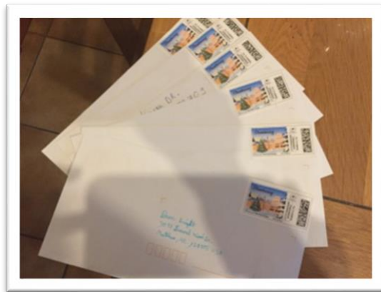
Anglais : les premières correspondances ont été reçues et nos cartes de fêtes envoyées.