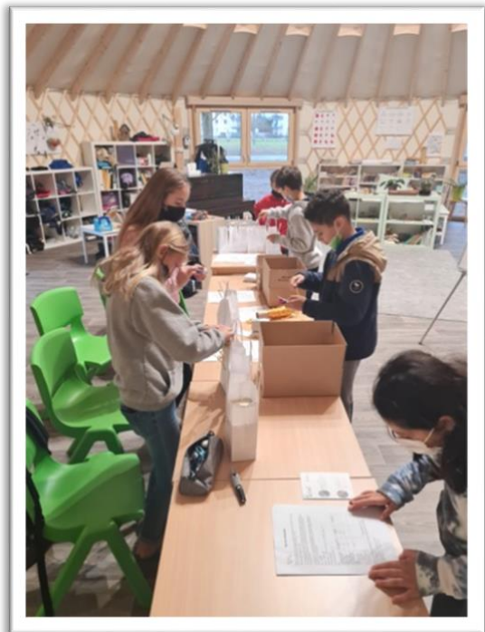
Entreprenariat : nos collégiens en plein travail de préparation de commande